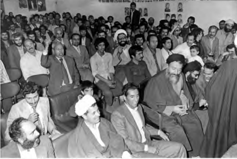
عبد السلام جلود يرأس الوفد الليبي للتهنئة بالثورة الإيرانية وإلى جانبه من اليمين السيد محمد بهشتي، ومن اليسار السيد علي أكبر هاشمي رفسنجاني، إيران، 1979.